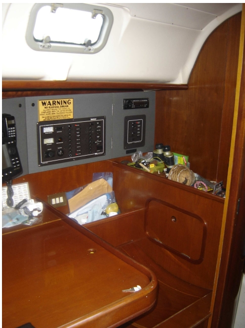
Table à carte bien accessible et complète avec beaucoup de rangement pratique. Panneau avec disjoncteur 12 volts et 120 volts.

Intérieur: 3 chambres à coucher double, chambres arrière très bien ventilé par 3 écoutilles / chambre, eau pression chaude (échangeur et 120V) & froide.