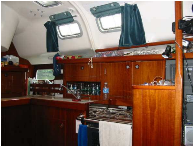
Cuisine fonctionnel avec cuisinière Eno 3 ronds et fourneaux sur cardan. Frigidaire 12 volts, évier double et beaucoup de rangement