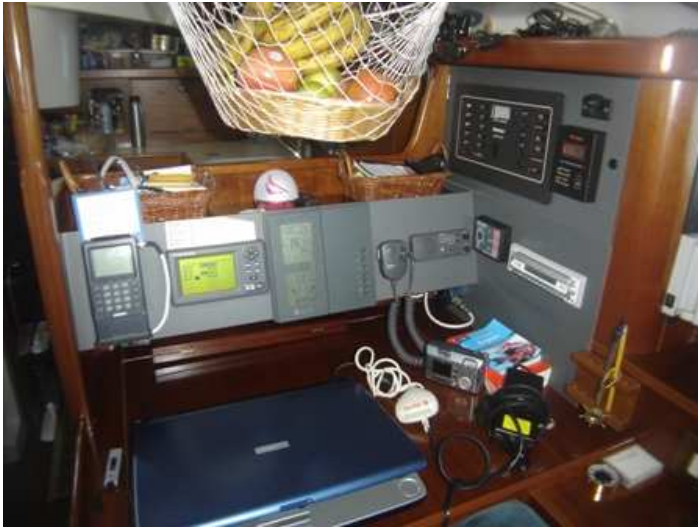
Table à carte bien accessible et complète avec beaucoup de rangement pratique. Panneau avec disjoncteur 12 volts et 120 volts.