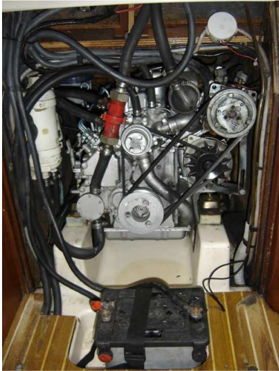
Moteur : Perkins M30 avec échangeur

Système de bossoir et arche facilitant les opérations du dinghy