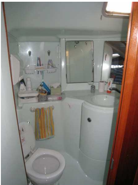
Grande salle de bain avec eau sous pression et eau chaude,