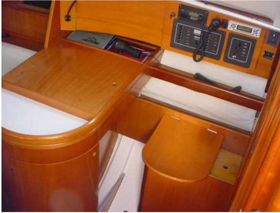
Table à carte bien accessible et complète avec beaucoup de rangement pratique. Panneau avec disjoncteur 12 volts et 120 volts.