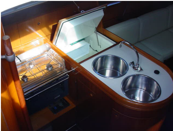
Cuisine avec cuisinière Eno 2 ronds et fourneaux sur cardan. Frigidaire avec compresseur 12 volts, évier double.