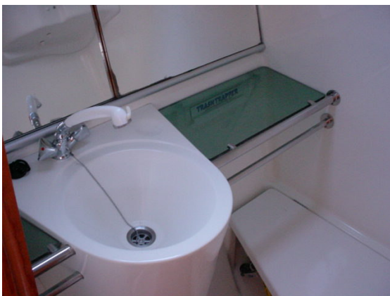
Grande salle de bain avec eau sous pression et douche (eau chaude).