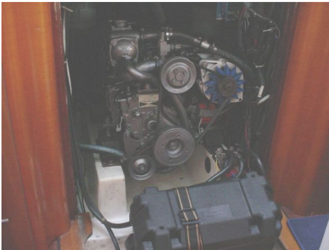
Moteur: YANMAR 3GM30F 30 HP 1200 HEURES AVEC ÉCHANGEUR.