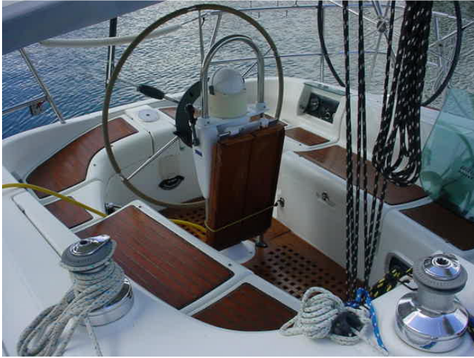
Grand cockpit avec table à manger mobile. Barre à roue pliante et une de rechange non pliante.