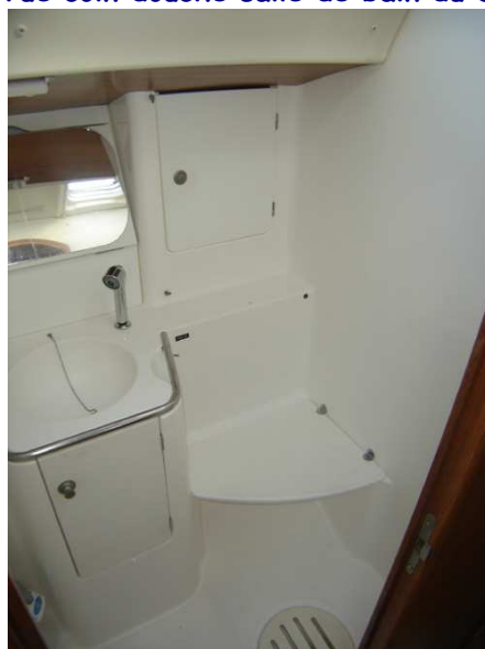
Vue coin douche salle de bain du carré