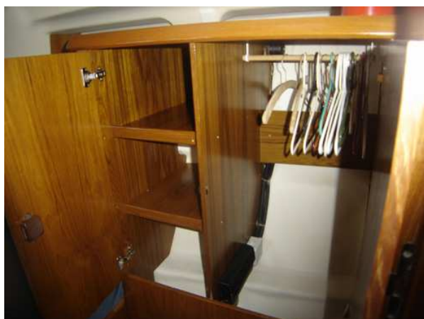
Vue garde robe chambre arrière