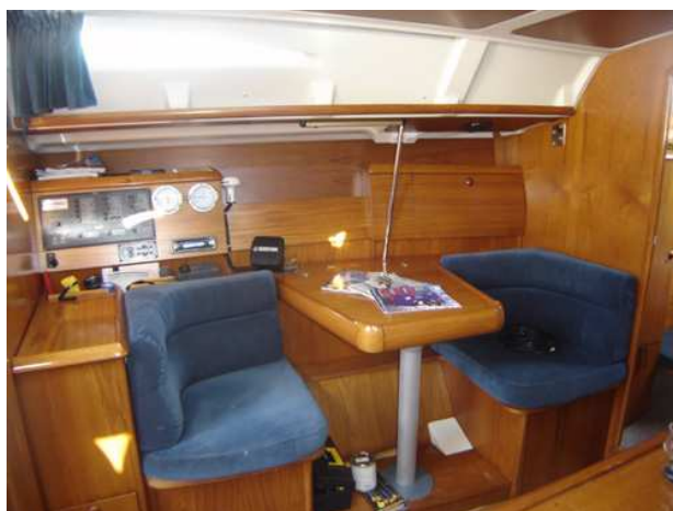
Vue table à carte et causette