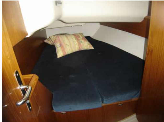
Vue chambre arrière