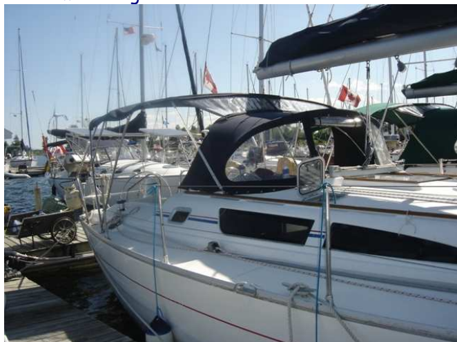
Vue bimini-dodger et liaison