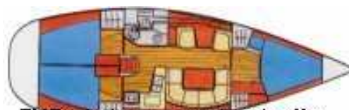
EYB photo non contractuelle