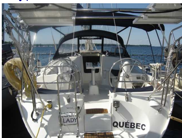
Vue jupette :