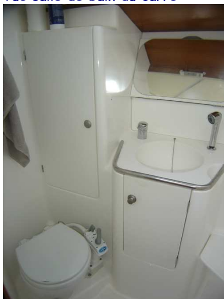
Vue salle de bain du carré